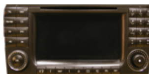
MB Comand 220