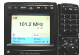
MB Comand 2.5d