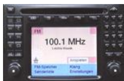
MB Comand 2.0e