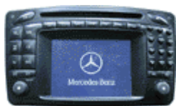
MB Comand 2.0