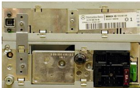
MB Comand 2.0, 2.0e, 220