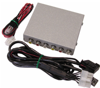
AV-input Comand 2.0, 220

Устройство предназначено для организации аудио-видео входов в систему MB Comand при отсутствии штатного ТВ-тюнера. Оно имеет два аудио-видео входа, работающих в стандарте SECAM, PAL, NTSC. Активируется видеовход через стандартное меню MB Comand. Как и в штатном ТВ-тюнере имеется возможность регулировки звуковых и цветовых параметров.