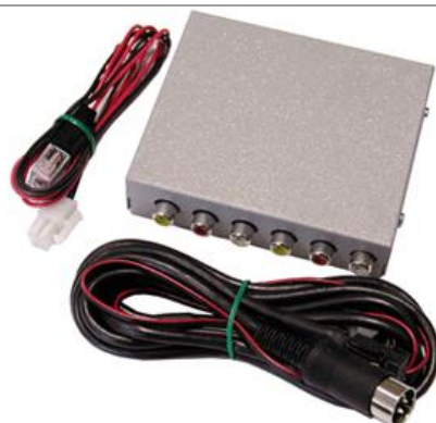
AV-input Comand 2.5