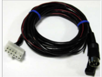
для MB Comand 2.5

секция C1 > (8 контактов) секция C2 > (18 контактов)