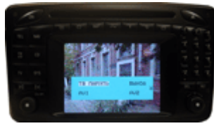
Comand 2.0e W203, W209, W463