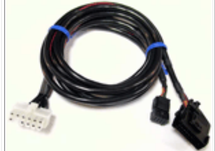
для MB Comand 2.0, 220

Гарантия на устройство - 12 (двенадцать) месяцев.