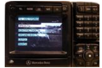
Comand 2.5 W215, S220 (1998-2002)