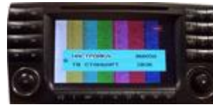
Comand 220 W215, S220 (2002-2004)