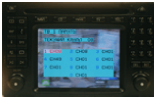
Comand 2.0 W163, W208, W210